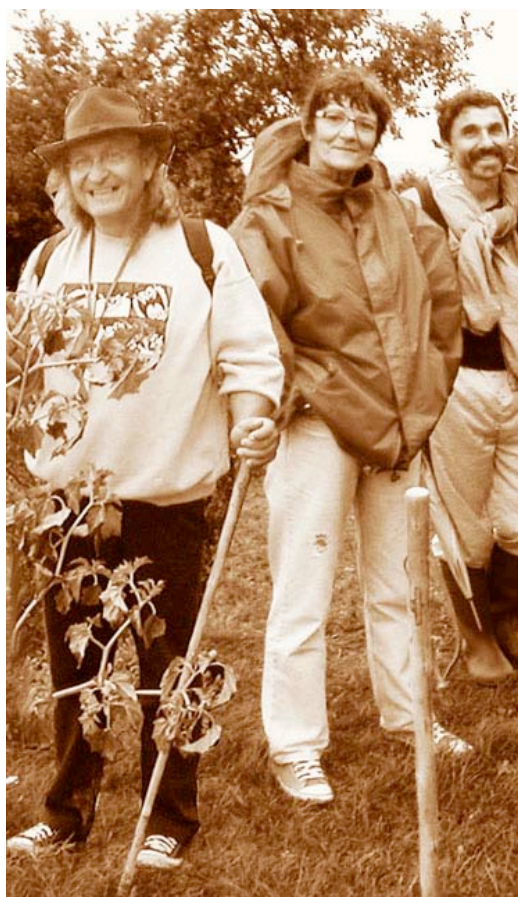
2006 – La Rando-Nez annuelle à Montégut Lauragais

Sur la piste des anciens distillateurs de plantes, des gantiers parfumeurs, des prospecteurs d'odeurs nouvelles, elle se propose de vous servir de guide.