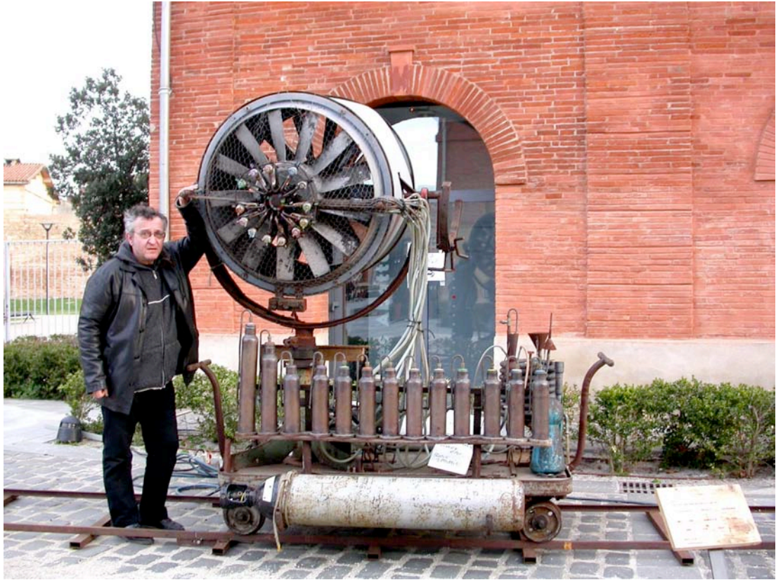
LA MACHINE À ODEURS – « LE PEPLUM » DE LA COMPAGNIE ROYAL DE LUXE