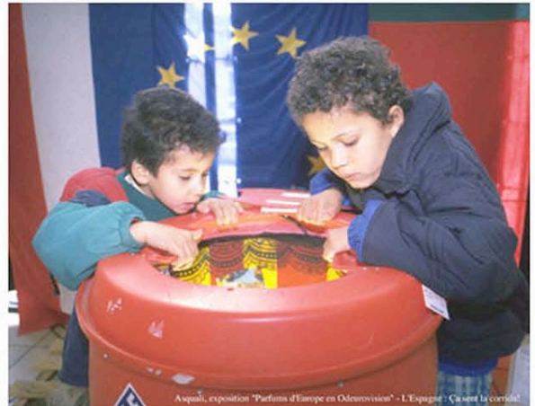
Asquali, exposition "Parfums d'Europe en Odeurovision" - L'Espagne - Ça sent la corréol