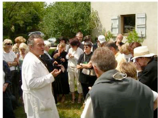
Le Jardin de senteurs