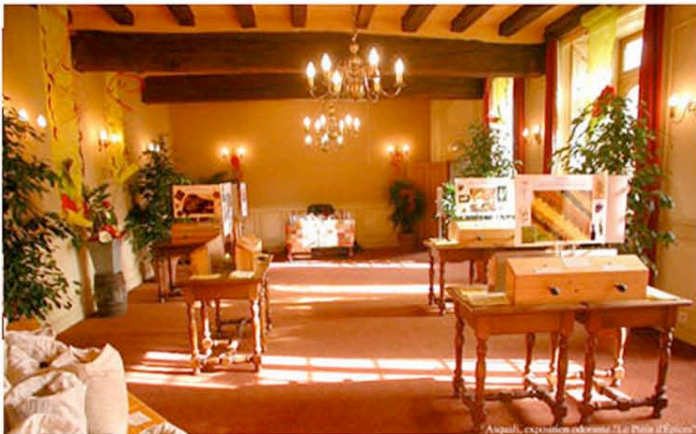
Asquali, exposition odorante "La Pinta d'Epice"