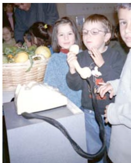
Téléphones olfactifs – Parfums d'agrumes au bout du fil !

Les réalisations, expositions, animations et formations d'Asquali sont une illustration de la médiatisation olfactive. Elles font découvrir au public une utilisation de l'odeur qui n'est ni alimentaire, ni lessivielle, ni de parfumerie mais de culture scientifique et technique.