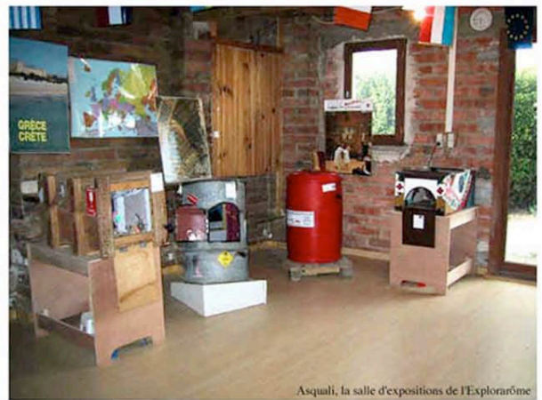
Asquali, la salle d'expositions de l'Explor@ôme