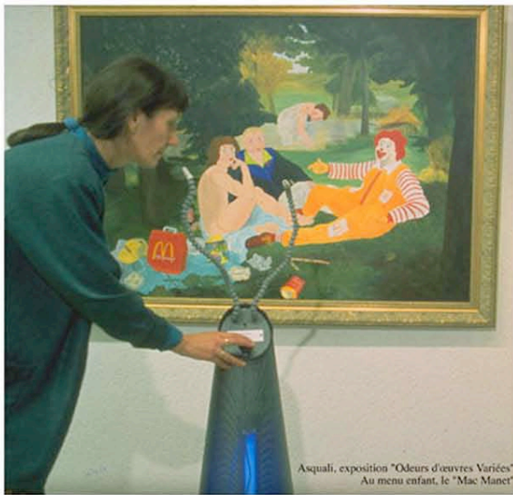
Asquali, exposition "Odeurs d'œuvres Variées" Au menu enfant, le "Mac Manet"