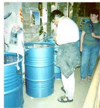
La Salle d'Expositions